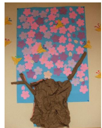
切り絵の作品(さくら)